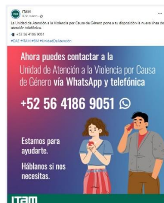
Publicación de campaña continua de promoción del protocolo en la red social Facebook