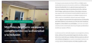
Nota sobre cobertura sobre las actividades de los miércoles de género