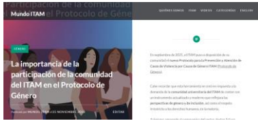
Nota sobre La importancia de la participación de la comunidad en el Protocolo de Género