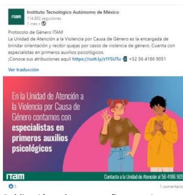
Publicación de campaña continua de promoción del protocolo en la red social LinkedIn