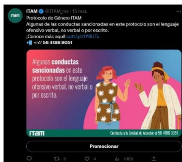
Publicación de campaña continua de promoción del protocolo en la red social Twitter

Es importante destacar que las interacciones totales en las redes sociales de Twitter, Facebook y LinkedIn ascendieron a 248, 313 y 197 respectivamente, logrando un total acumulado de 758 interacciones.